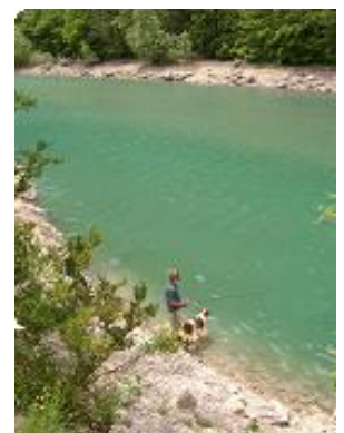
[24] Le sentier des pêcheurs.