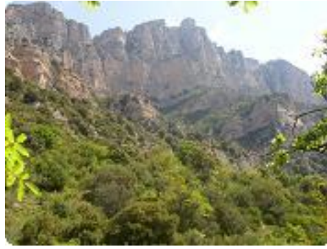
[2] Vue sur les falaises de gauche.