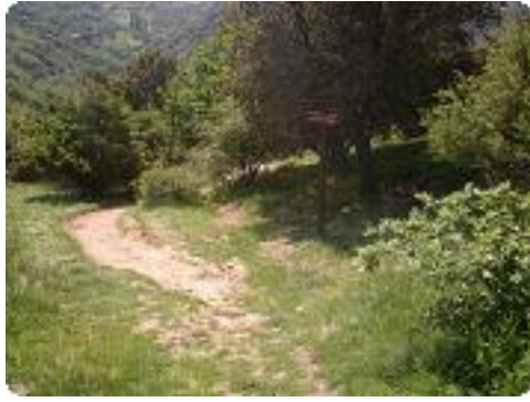
[1] Départ du col de l'Olivier.