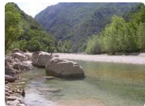
[12] Un paysage magnifique.