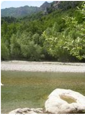
[13] Traverse vers l'autre bord facile.