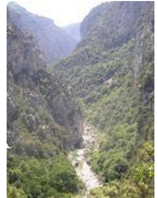
[6] Une autre possibilité de balade.