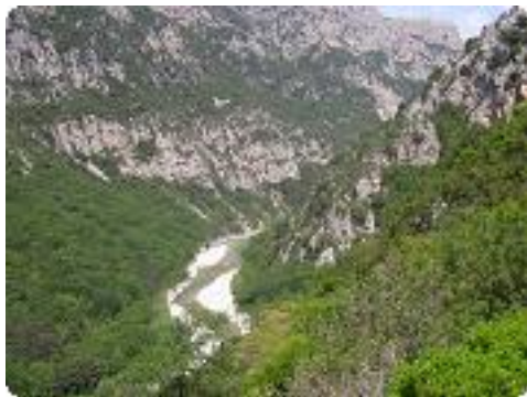
[7] La descente.