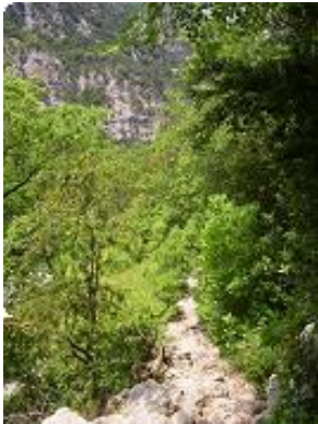
[16] Le sentier.