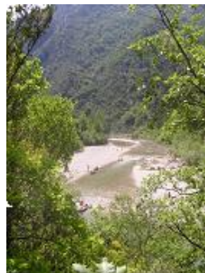
[11] Quittez le jaune.