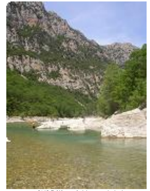
[15] Déjà agréable pour le bain.