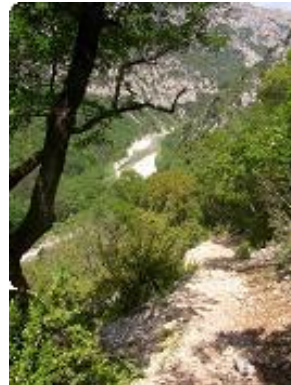
[8] Le sentier.