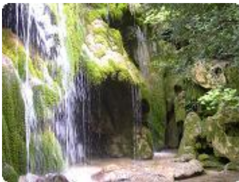
[26] La cascade.