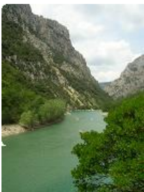
[22] Le Verdon vers Galetas.