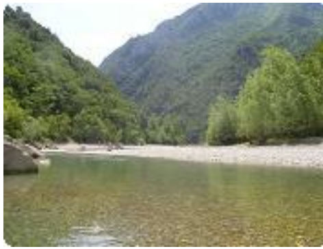
[14] Une eau claire et limpide.