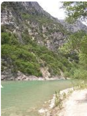
[19] Le sentier longe la rivière,