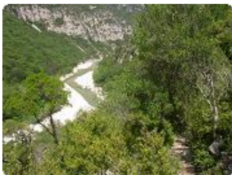
[10] Le Verdon et le sentier.