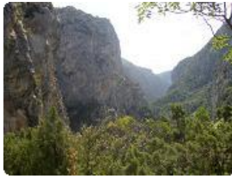
[5] Les Gorges.