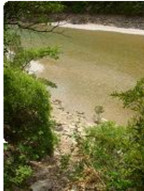
[17] D'autres passages vers la rivière.