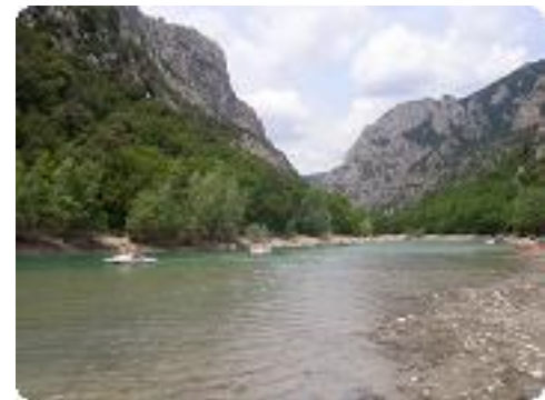
[21] Arrivée en zone dégagée.