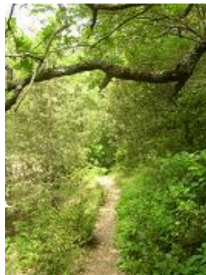
[20] puis s'en éloigne (un peu).