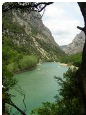
[23] Le Verdon vers Galetas.