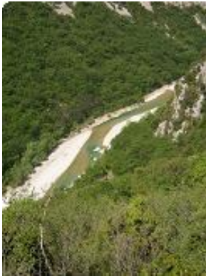
[4] Première vision du Verdon.