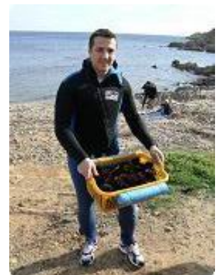
[12] Des oursins.