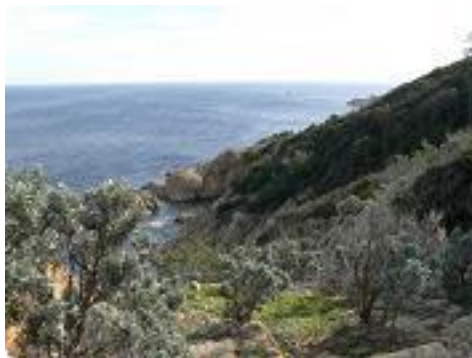
[23] Le paysage.