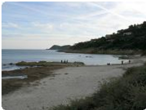
[55] La plage de L'Escalet.