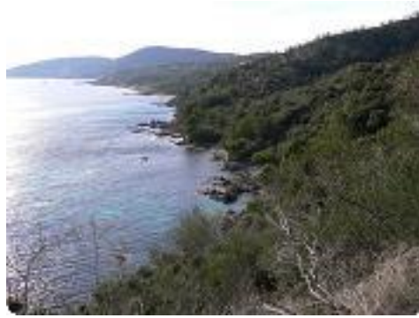
[50] La descente.