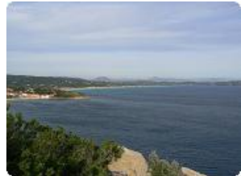
[21] vers St-Tropez.