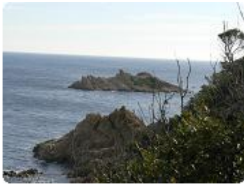
[25] Le cap Camarat.