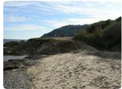
[9] Le sentier littoral.