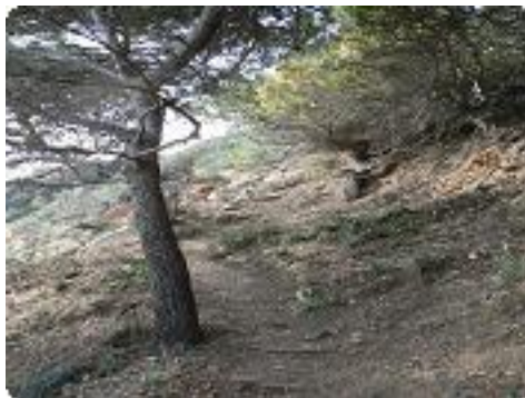
[35] Le sentier.