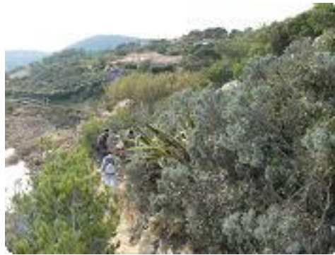
[53] Le sentier.