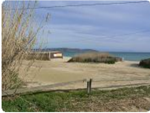
[1] Descente vers la plage.