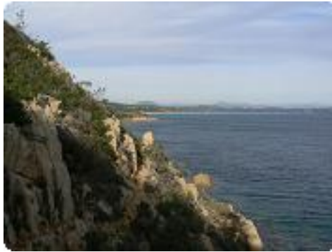
[17] vers St-Tropez.