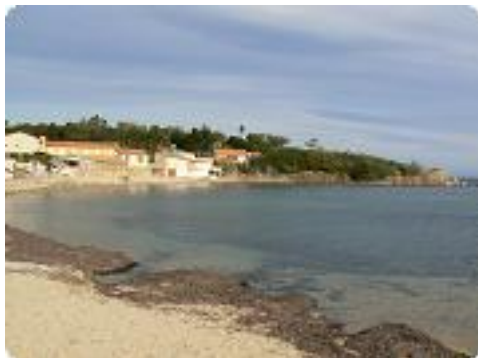
[10] Le hameau de Bonne Terrasse.