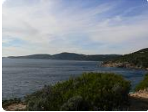
[38] La vue.