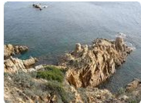
[36] Le côté.