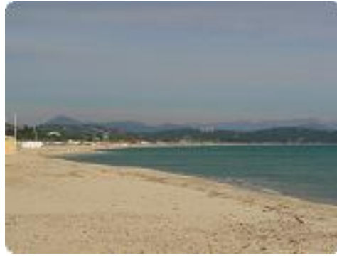
[2] La plage de Pampelonne.