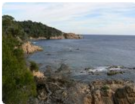
[44] La côte.