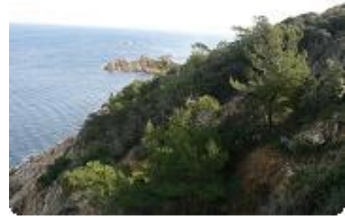
[27] Le cap Camarat.