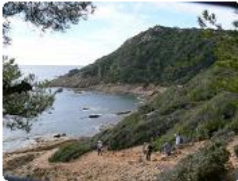
[32] Descente dans la baie.