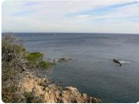
[37] La côte.