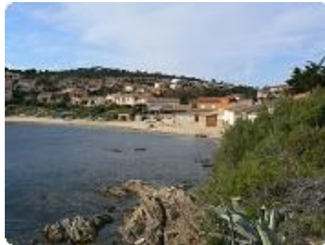
[8] Le hameau de Bonne Terrasse.