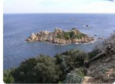
[30] Le cap Camarat.