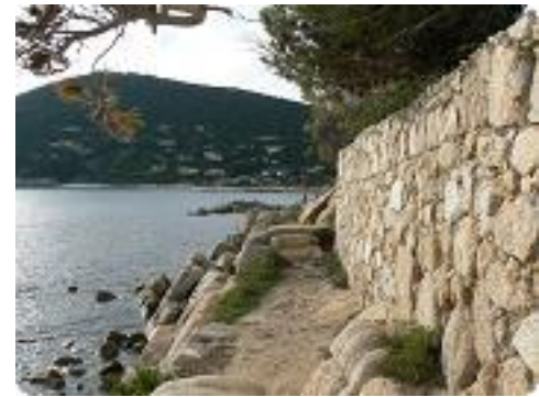
[54] Le sentier.