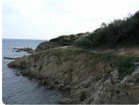
[5] Le sentier littoral.