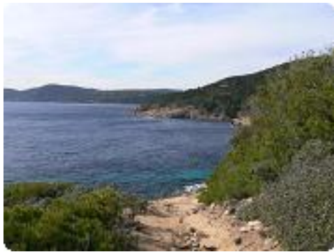
[40] Le sentier.