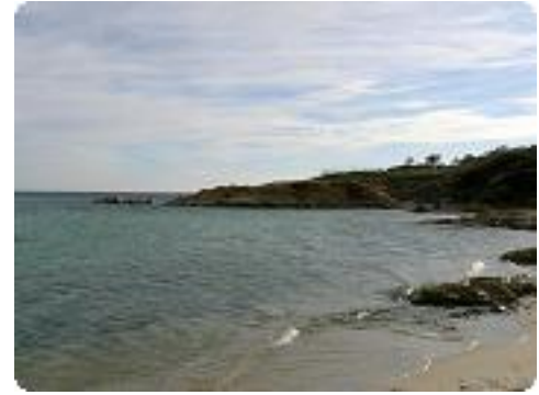
[3] Notre direction.