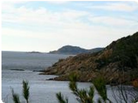
[31] Le cap Taillat.