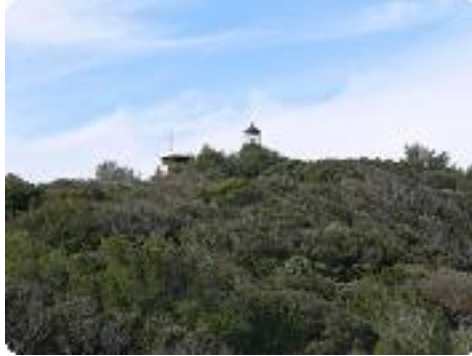
[29] Le phare.