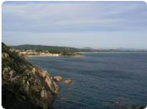
[19] vers St-Tropez.