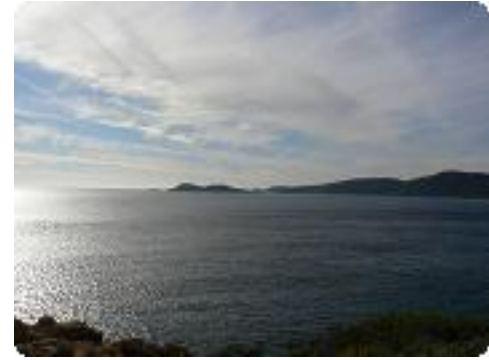
[39] La vue.