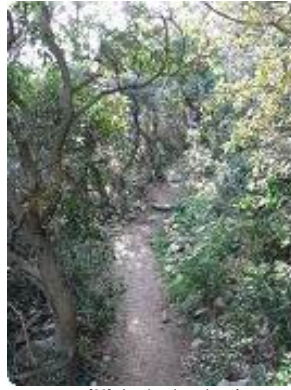
[26] Le chemin ombragé.