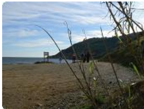
[11] Le sentier littoral.