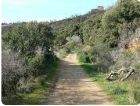
[49] Le chemin.