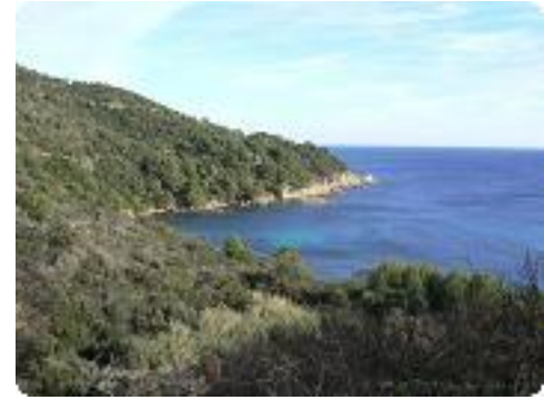
[51] Le paysage.