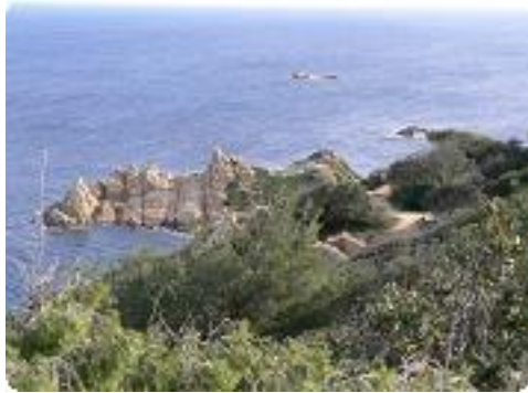
[28] Le cap Camarat.