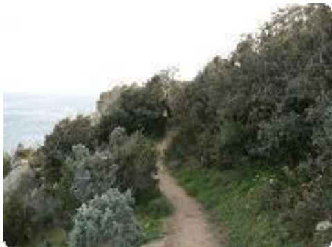
[22] Le sentier.