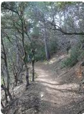
[43] Le sentier.