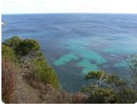
[52] La mer.