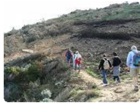
[15] Paysage brûlé.