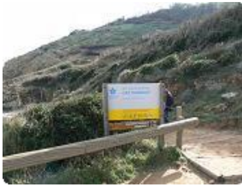
[14] entrée sur le domaine du Conservatoire.