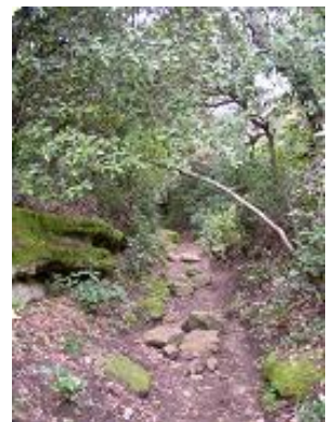
[12] Zone humide.