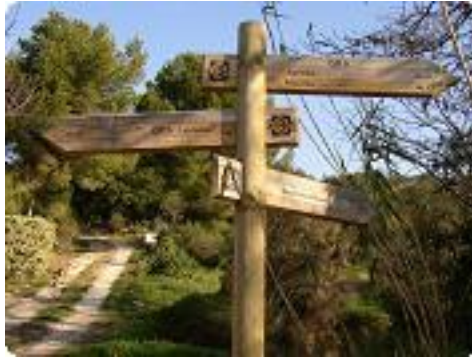
[2] Direction 'Lamanon'.