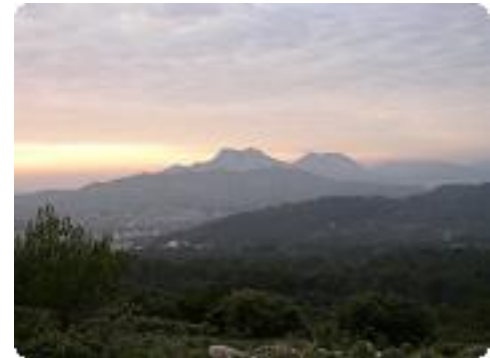
[21] La nuit arrive, la balade est finie.