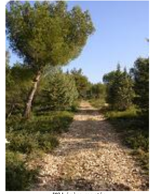
[3] Légère montée.