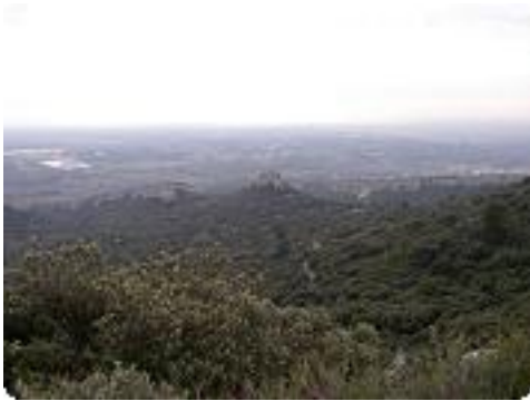
[7] La vue.