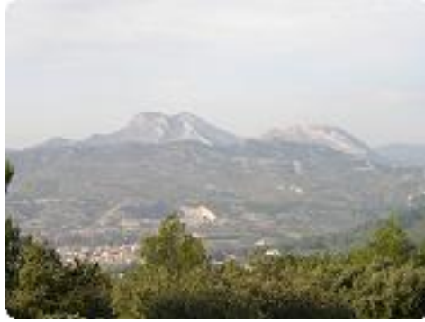
[5] Vue sur les collines des 'Alpilles'.