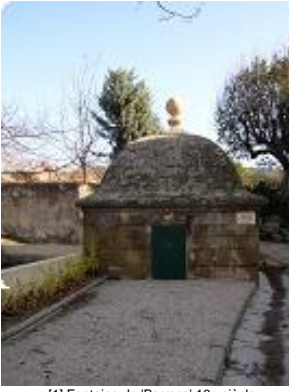
[1] Fontaine de 'Bormes' 16e siècle.