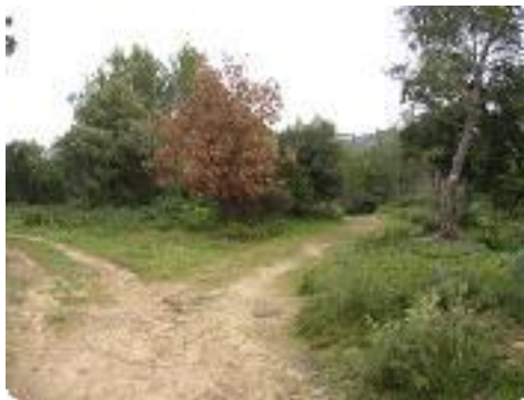
[11] Euh...à droite.