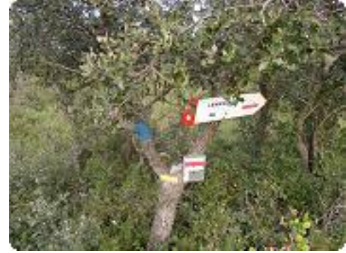
[6] Direction 'Lamanon'.