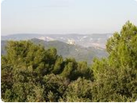
[4] Vue sur les ruines du château 'Castillas'.