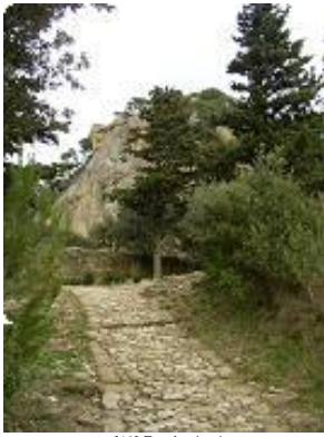
[13] Entrée du site.