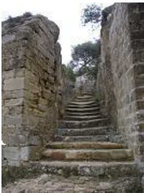
[19] Les escaliers d'accès à la hauteur.