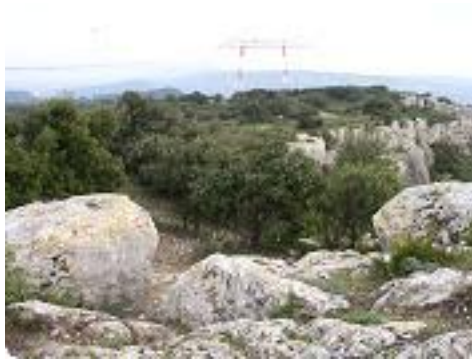
[8] The obstacle.