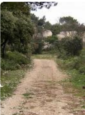
[10] Tout droit.