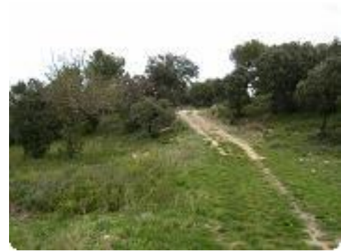
[9] Zone verdoyante.