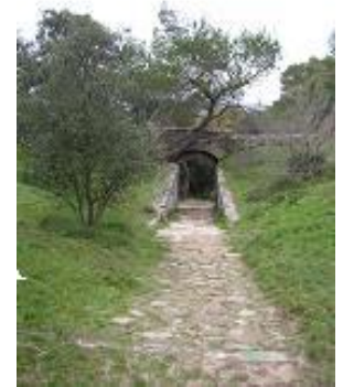
[18] La porte arrière.