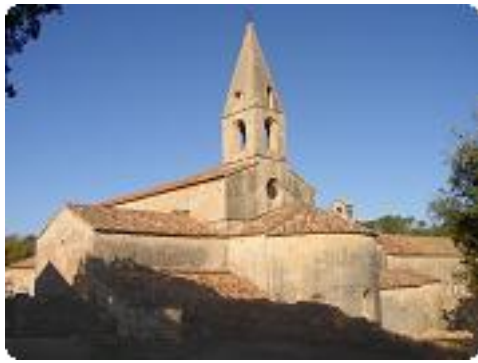
[13] L'abbaye, vue du cimetière.