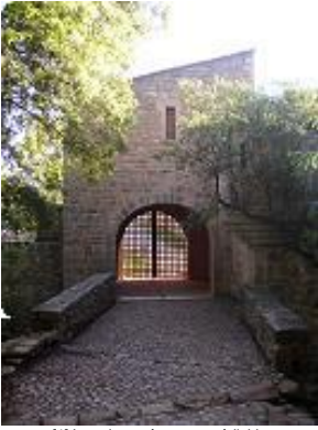
[1] La voie pavée menant à l'abbaye.