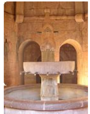
[9] La fontaine.