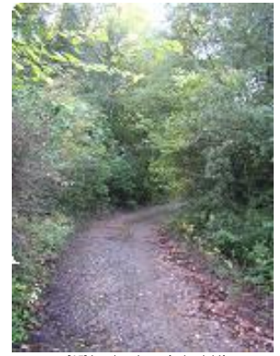
[15] Le chemin après la clairière.