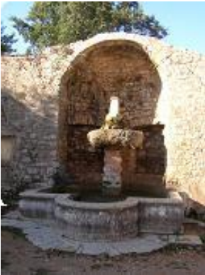
[4] Une petite fontaine.