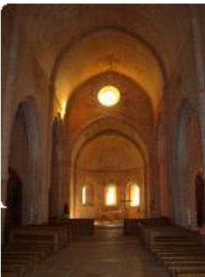
[7] L'intérieur de l'église.