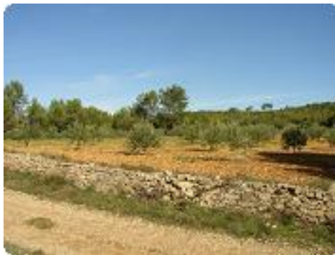
[20] Champs d'oliviers sur la droite.