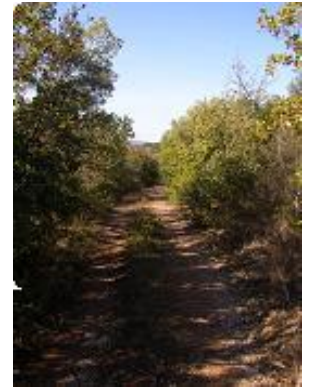
[18] Une dernière côte.