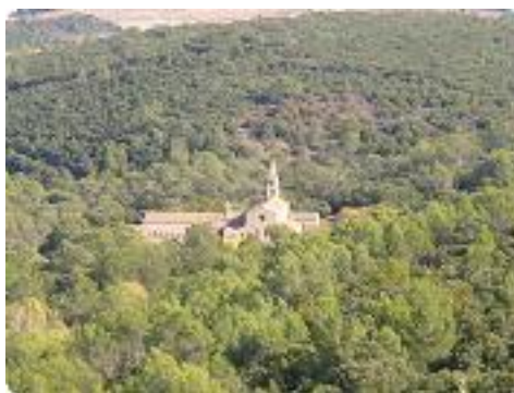
[23] Vue sur l'abbaye depuis la colline.