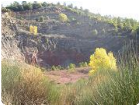
[16] Une carrière de bauxite.