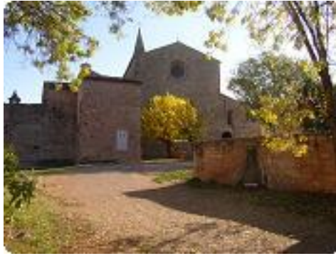
[2] Vue à l'entrée dans le site.