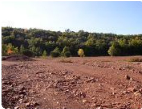
[17] Un grand terre plat d'allure martien.