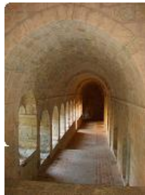
[8] Longeant le bâtiment des moines.