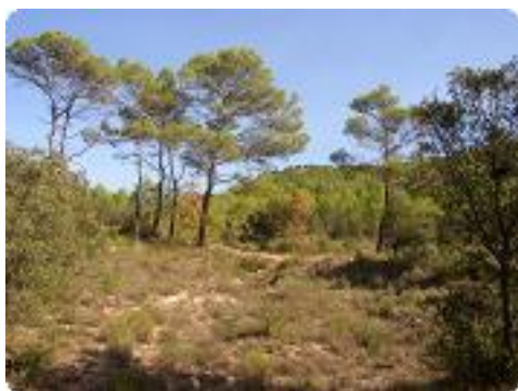
[22] Dernière montée.