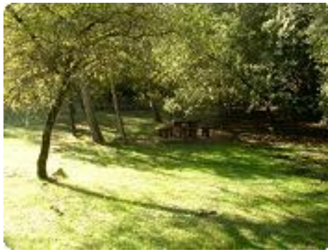
[14] La clairière.