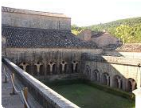
[11] Le cloître.