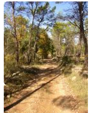
[21] Le chemin avant la route.