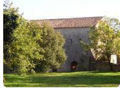
[3] Le cellier.